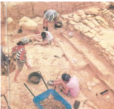
Detalle de los trabajos

No será hasta 1991 cuando se certifique la existencia de este yacimiento arqueológico de la Edad de Hierro, como digo descubierto y catalogado en el año 1991 con ocasión de realización de unas catas arqueológicas previas para la construcción de unas instalaciones deportivas, instalaciones que lógicamente fueron trasladadas a otra zona de Berbinzana.